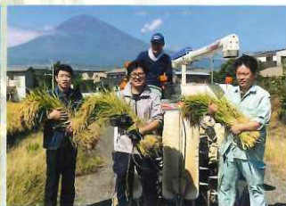
稲刈りをするくら店長と従業員